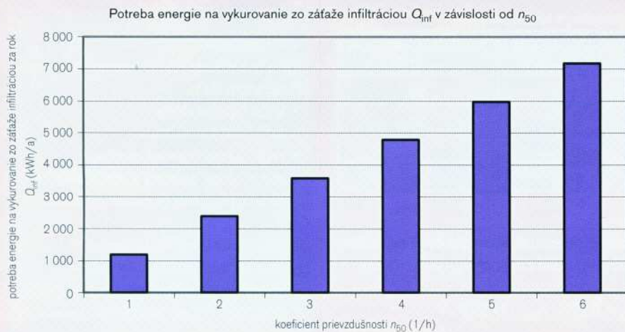
Obr. 1 Potreba energie na vykurovanie zo záťaže infiltráciou Q_c v závislosti od koeficientu priepustnosti n_{50}

na izoláciu a tesnosť. Straty energie stoja pe- niaze a bez tesnosti sa celá izolácia nevyuži- je, takže sa obvodový plášť budovy musí sta- vať tesný. To by malo byť predmetom záujmu všetkých zúčastnených strán. Blower Door test patrí už mnoho rokov k stavbe nízkoener- getických domov a vzduchotesnosť budovy sa tým stáva znakom kvality.